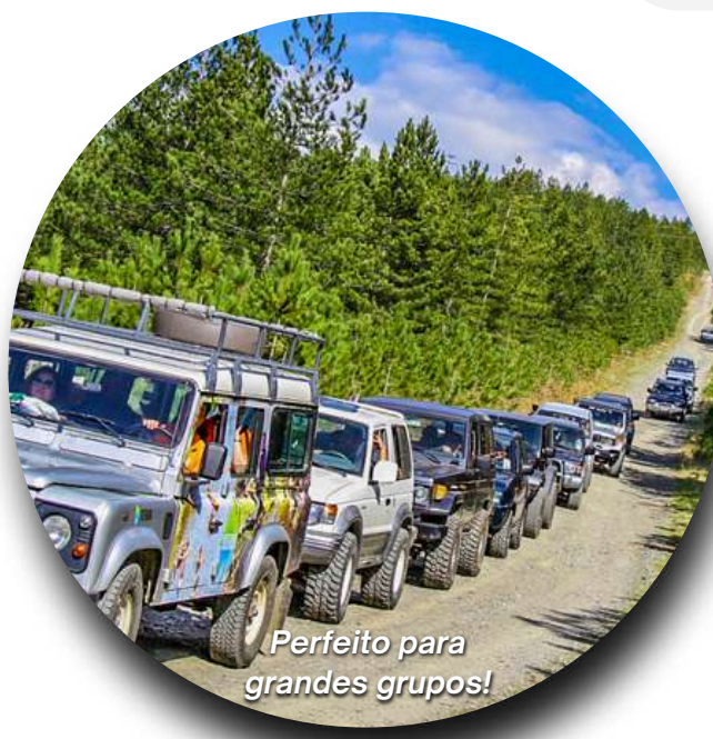
Perfeito para grandes grupos!