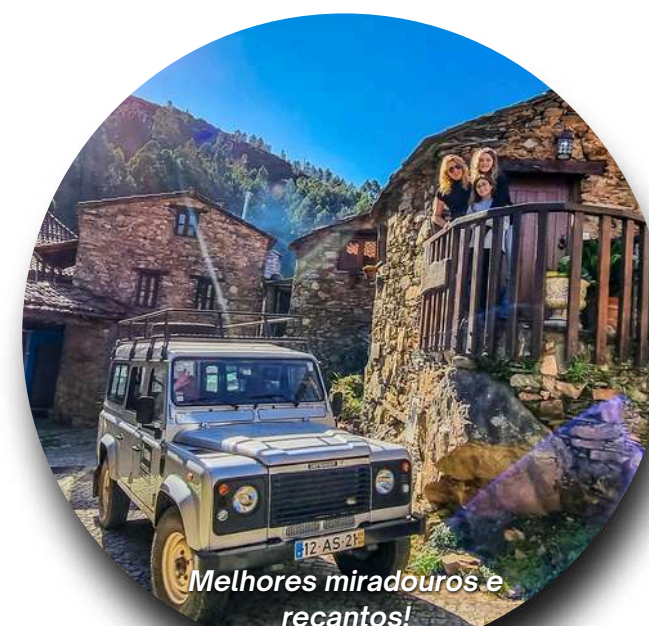
Melhores miradouros e recantos!