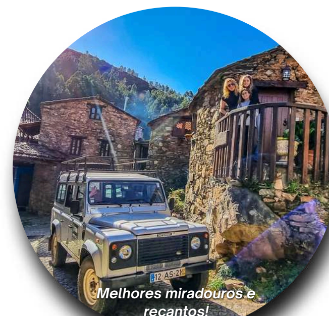
Melhores miradouros e recantos!