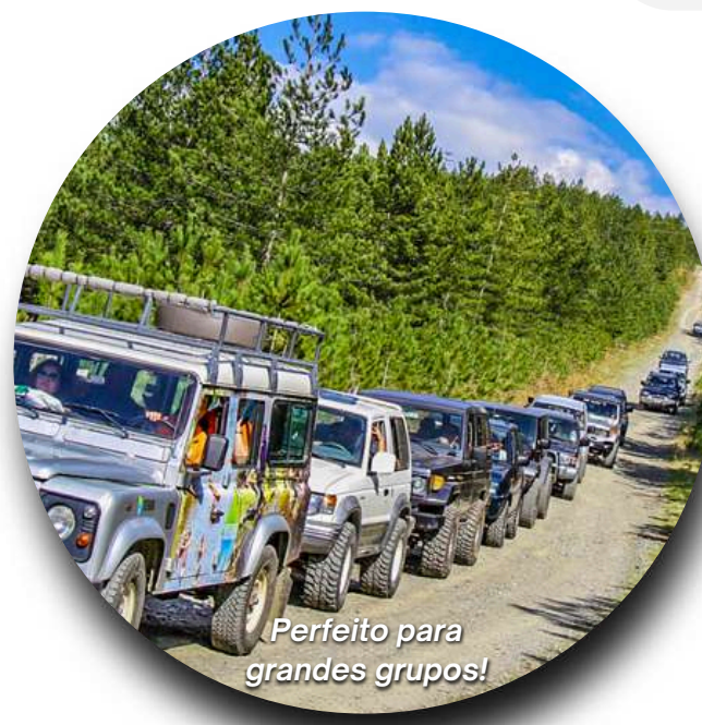
Perfeito para grandes grupos!